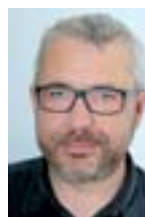
Thierry MEYSSONNIER secrétaire national

pas suffisant. En janvier, au moment de l'affichage des vœux et des barèmes sur I-Prof (voir les dates d'affichage selon calendrier spécifique pour chaque académie), contactez à nouveau vos élus académiques SNES-FSU pour vous assurer que tous les éléments du barème auxquels vous pouvez prétendre ont bien été pris en compte et pour être aidé dans une démarche de réclamation auprès du rectorat